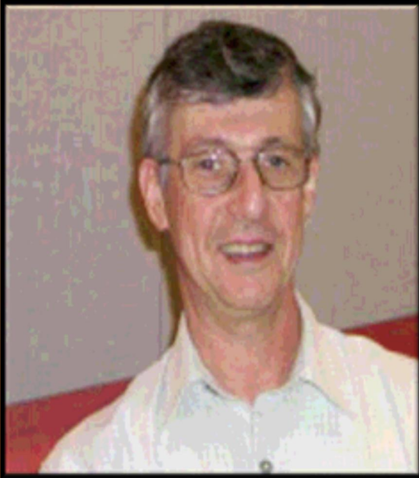
Ronald P. Fisher