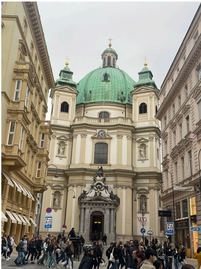
Peterskirche (a bécsi Szent Péter-templom)