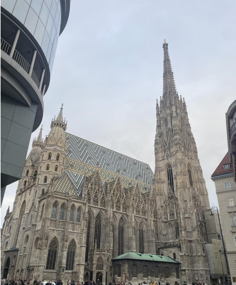
Bécs, ember háza – Isten háza