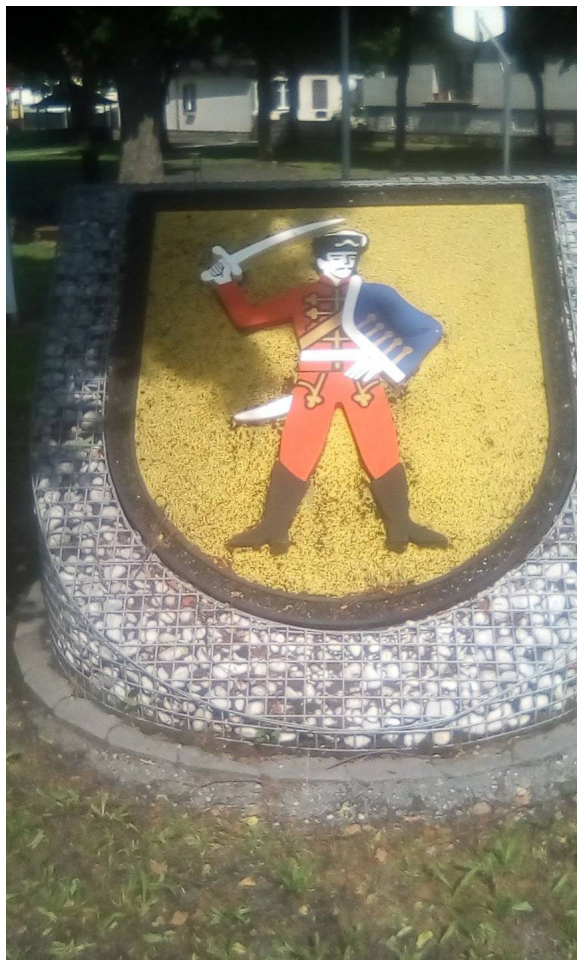
Alsóör (Unterwart) címere