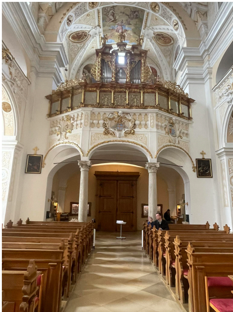
Burgenland legszebb barokk római katolikus templombelsője – Frauenkirchen (Fertőboldogasszony)