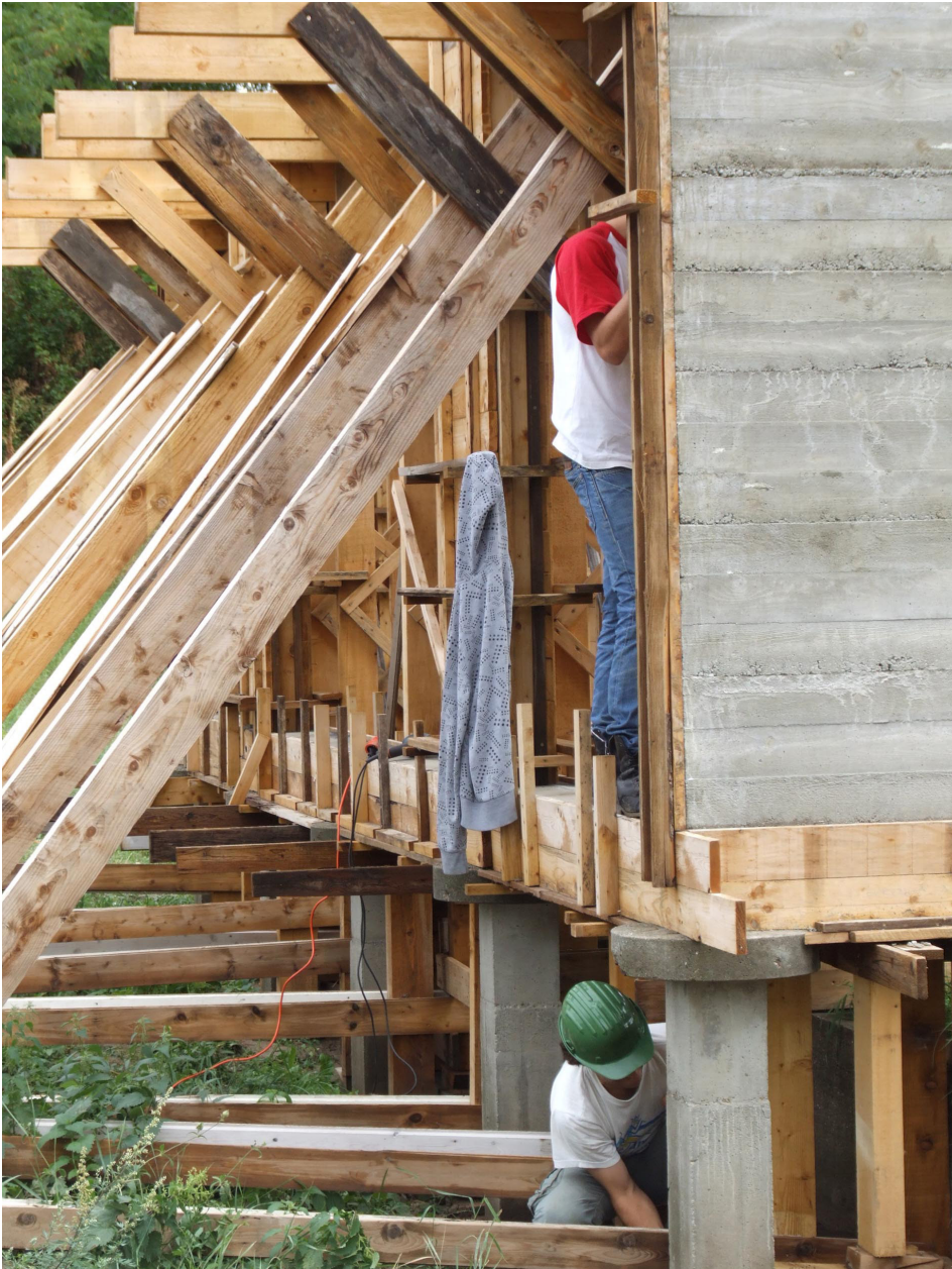
Vasbeton kukoricagóré szerkezetépítése. 2013, Perbál.